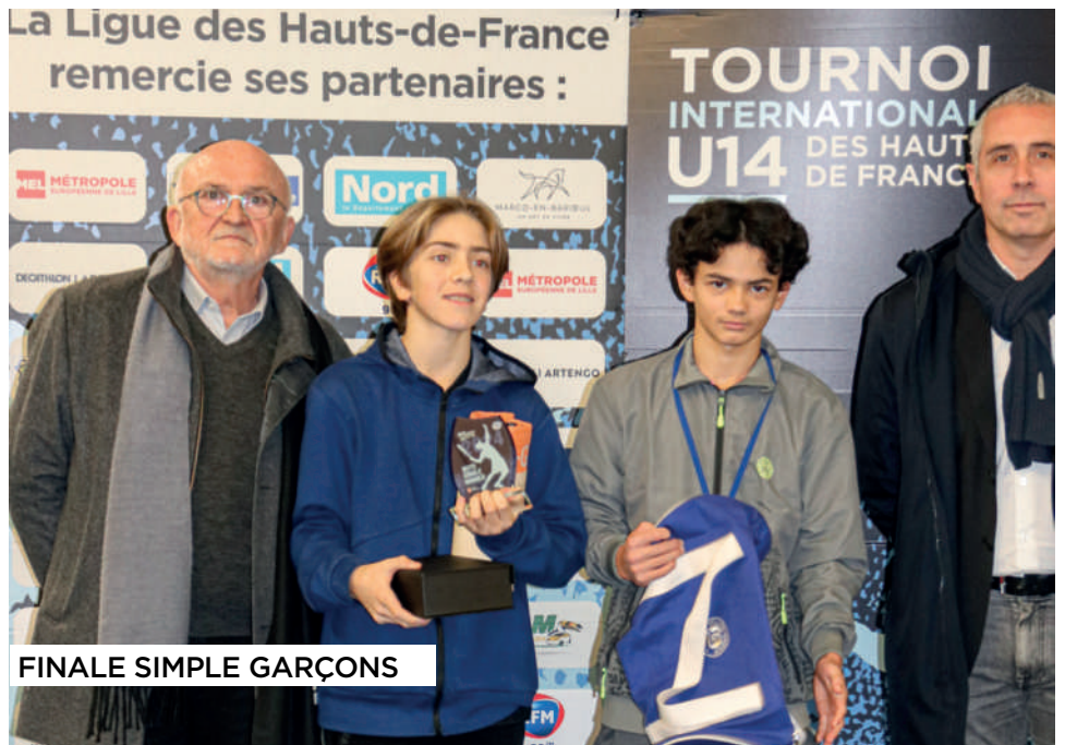
FINALE SIMPLE GARÇONS